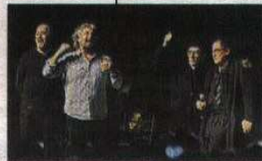
CELENTANO SUL PALCO

Sono davvero tanti, nel corso degli anni, gli eventi culturali che hanno visto protagonista il Cep.